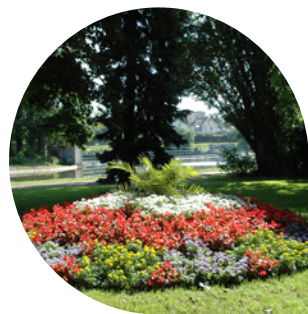
Le parc de l'Arbre-sec, aménagé au début du XIX ème siècle – une nature ordonnée en parterres et allées.

Les parcs et jardins citadins sont une occasion pour les urbanistes, les jardiniers ainsi que les promeneurs de créer ou de s'immerger dans une nature reconstituée par les Hommes. En cela, ils reflètent les attentes ou les centres d'intérêt d'une population à une époque.