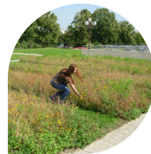
Jachère fleurie, place de l'Arquebuse – une place faite à une nature plus exubérante, à la fin du XIX ème siècle.