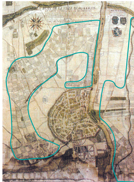
Plan d'Auxerre, 1713

Les parties hachurées indiquent la présence de vignes tout autour de la ville. Ces zones sont aujourd'hui occupées par les quartiers des Brichères, Sainte-Geneviève et Saint-Siméon. Toute la rive droite est également urbanisée.