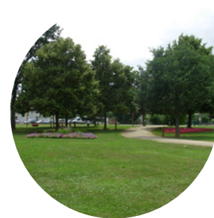
L'Arboretum créé en 1981 – trois hectares pour découvrir la diversité des arbres