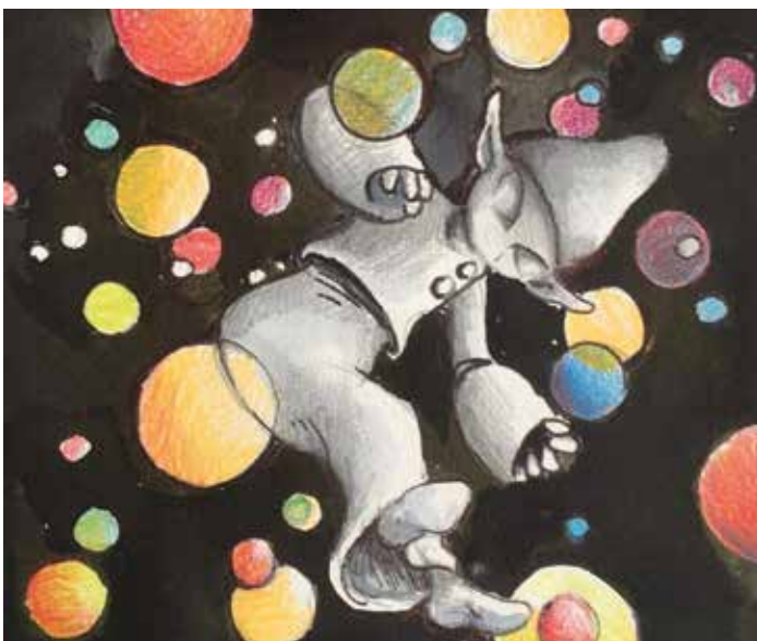
← Alféa, l'héroïne de l'histoire extraordinaire La jeune Alféa de la planète Zérion part sur Terre pour une belle aventure. Une création de Jean-Charles Meslaine. →