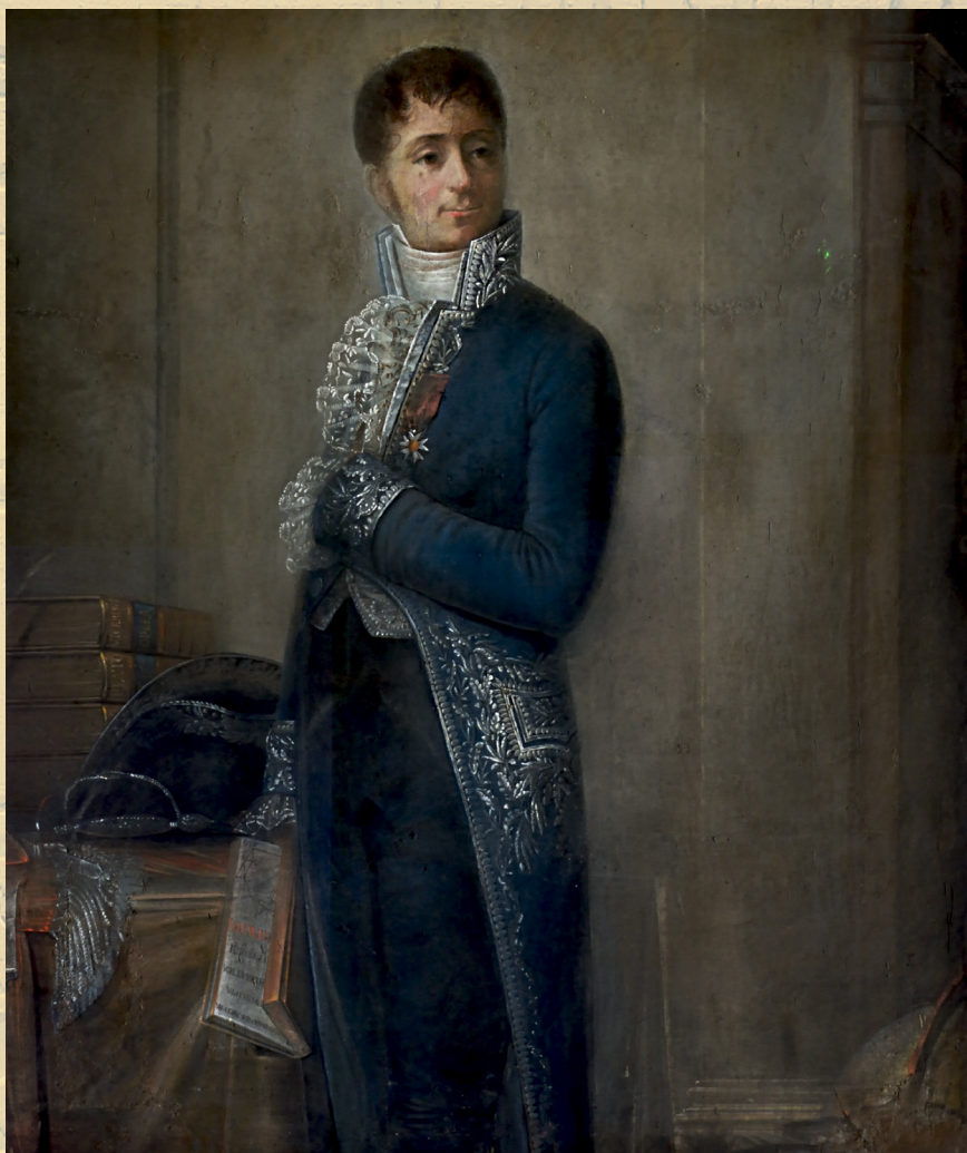
Le baron joseph fourier, XIXième siècle