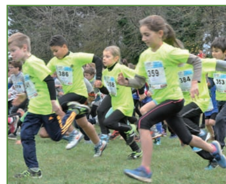
Cross de l'Yonne Républicaine dimanche 19 novembre de 11 à 15 heures. Site des Piedalloues.

En grandes ou petites foulées, en longues enjambées ou pour le simple plaisir d'accompagner l'un de ses enfants, tout est réuni pour que cette édition soit un nouveau succès. ★