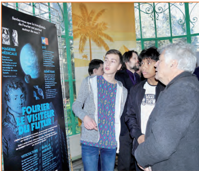
Sur les traces de l'Auxerrois Fourier