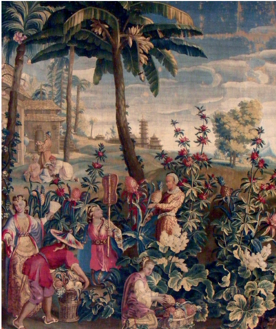
La récolte des ananas, laine et soie, XVIIIe siècle