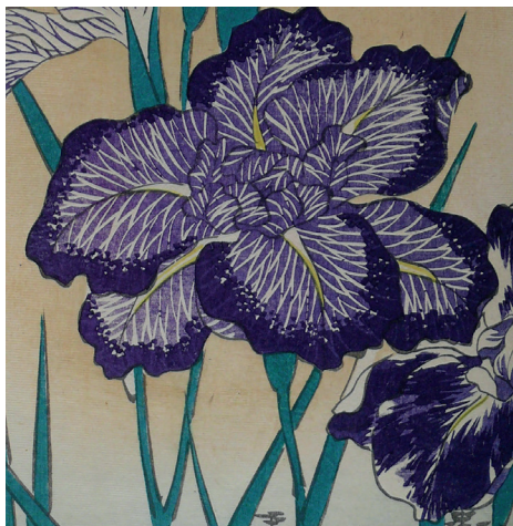
Trente six vues de fleurs , Utagawa Hiroshige