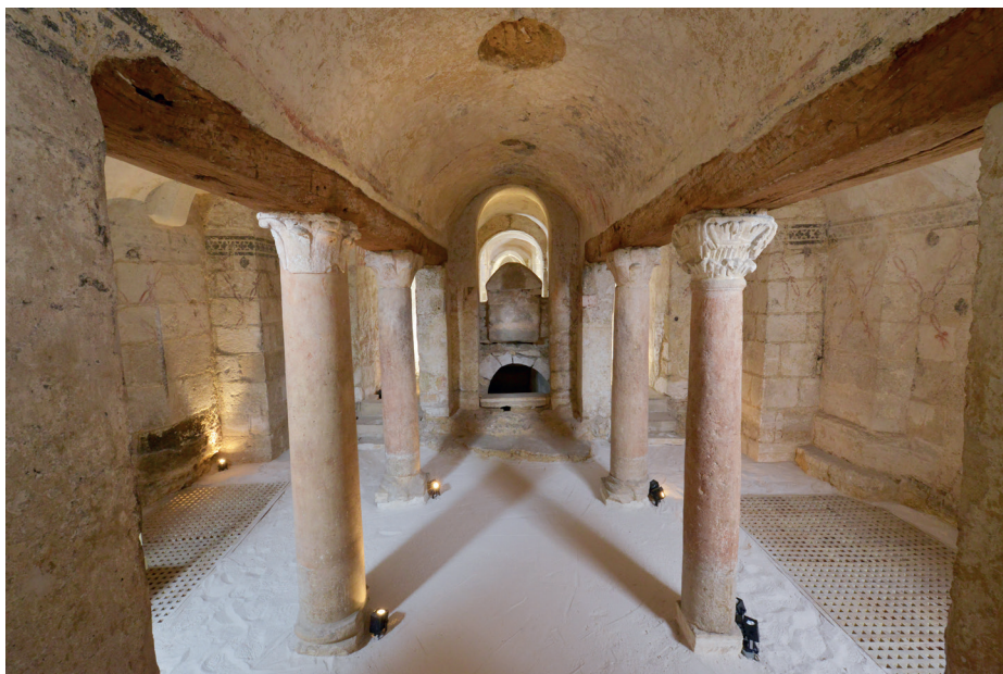
La Confession, IX e siècle, crypte de l'Abbaye Saint-Germain.

Des visites gratuites, d'une durée de 20 minutes, seront proposées toutes les demi-heures. Les groupes seront limités à 15 personnes. Les visites commenceront à 19 heures jusqu'à 23 h 30, après retrait du billet à l'accueil de l'Abbaye.