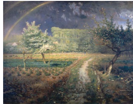
Jean-François Millet Le Printemps (collection #2)

Traité pendant longtemps par les artistes comme élément d'arrière-plan de la représentation picturale, le paysage s'émancipe à partir du 17 e siècle jusqu'à devenir un genre autonome au 19 e siècle. Paysages romantiques, réalistes ou impressionnistes, faites un tour d'horizon du paysage dans l'histoire de l'art.