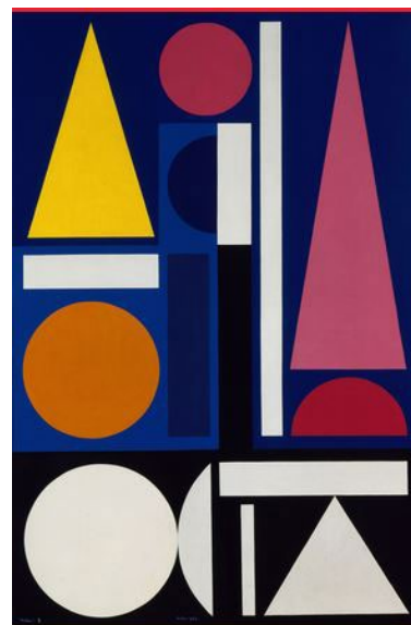
Auguste Herbin Matin II (collection Hauts-de-France)

Couleurs primaires, secondaires, cercle chromatique... De l'utilisation de pigments naturels à l'invention de la peinture à l'huile, la couleur n'a cessé de révolutionner le monde de l'art. Les artistes en exploitent toutes les facettes, s'intéressant aussi bien à sa relation avec la matière et la lumière qu'à la perception physique et sensorielle qui en découle. Vous en verrez de toutes les couleurs à la Micro-folie !