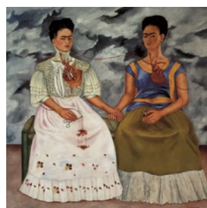
Frida Kahlo Les deux Frida 1939 (collection Mexico)

En partenariat avec deux grands musées du Québec : le musée des beaux-arts de Montréal et le Musée de la Civilisation, cette collection internationale nous offre une réflexion tant anthropologique qu'artistique sur l'histoire du Québec.