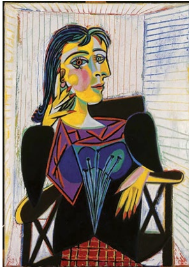
Pablo Picasso Portrait de Dora Maar (collection #2)

Appréhendez l'art du portrait dans ses différentes fonctions, au regard de l'évolution des styles et des courants artistiques, de l'autoportrait au portrait de pouvoir, en passant par le portrait d'expression ou le portrait insolite.