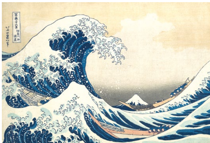
Hokusai Sous la vague au large de Kanagawa (collection #1)

Élément essentiel à la vie, l'eau est également une véritable source d'inspiration pour les artistes au cours des siècles. Paisible ou déchaînée, limpide ou sombre, elle