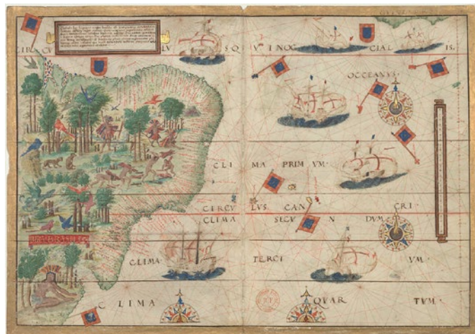
Lopo Homem, cartographe présumé L'Atlas Miller (collection #2)

Les voyages nourrissent la créativité des hommes depuis la Préhistoire jusqu'à nos jours. Réels ou imaginaires, ils ont permis aux artistes d'ouvrir leurs horizons et leurs sources d'inspiration. Comme eux, voyagez à travers l'espace et le temps à la découverte d'œuvres de civilisations proches ou lointaines.