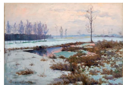
Maurice Cullen (1866-1934) Paysage près de Beaupré vers 1896-1897 (collection Québec)

Première collection internationale en partenariat avec l'Association des Résidences Royales Européennes.