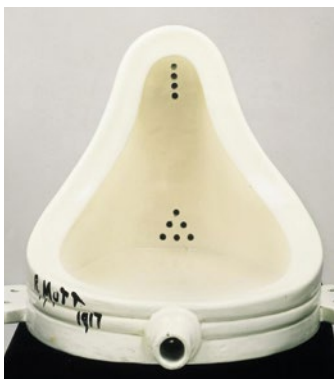
Marcel Duchamp Fontaine (Urinoir) (collection #1)

Qu'il soit sujet de la représentation artistique dans une nature morte du 16 e siècle ou bien matière première de l'œuvre dans un assemblage du 20 e siècle, l'objet occupe une place singulière au sein de l'histoire de l'art. Par cette thématique, découvrez comment l'objet permet aux artistes de questionner notre rapport au monde matériel.