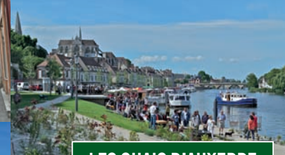
LES QUAIS D'AUXERRE