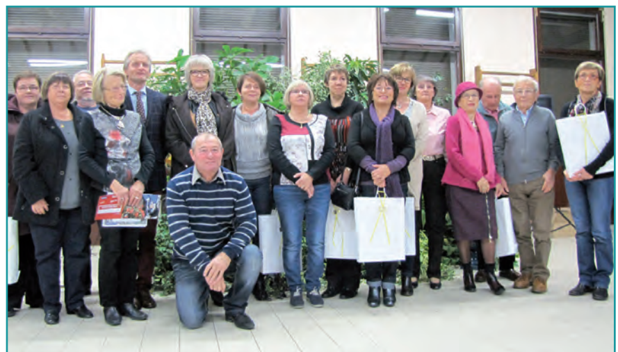
Maisons fleuries. Les remises de prix aux gagnants du concours des Maisons fleuries 2017 se dérouleront dans les quartiers, à 18 h 30, comme suit : Laborde (notre photo), jeudi 5 (salle Camille-Debay) ; Conches-Clairions, vendredi 6 (cité Gouré) ; Vaux, mercredi 11 (Maison de Vaux) ; Saint-Siméon, vendredi 13 (maison de quartier) ; Les Chesnez, lundi 23 (salle polyvalente) ; Piedalloues-La Noue, lundi 6 novembre (maison de quartier) ; Rive-Droite/Saint-Gervais/Brazza/Champoullains, lundi 13 novembre (pôle Rive-Droite) ; St-Julien/Saint-Amâtre-Boussicats/Moreaux-Centre-ville, jeudi 16 novembre (Maison Paul-Bert) ; Brichères/Sainte-Geneviève/Rosoirs, vendredi 17 novembre (Le Phare) ; Jonches, mercredi 22 novembre (Mairie).