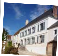
La Maison et le musée Colette à St-Sauveur-en-Puisaye