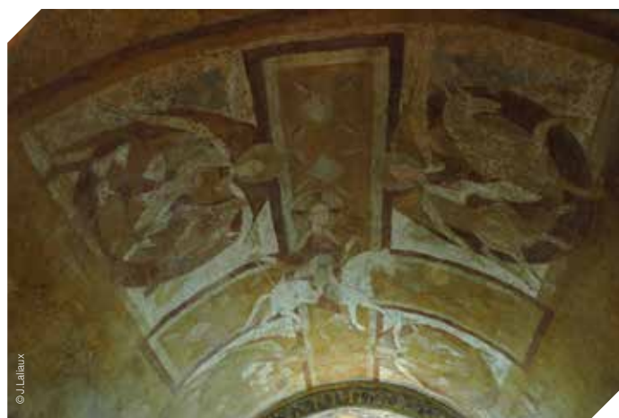
Crypte de la Cathédrale

La Cathédrale Saint-Etienne est d'une importance majeure pour l'exceptionnelle harmonie de ses proportions, la beauté de son site et la rareté de son iconographie.