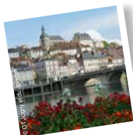
Joigny, ville d'Art et d'Histoire