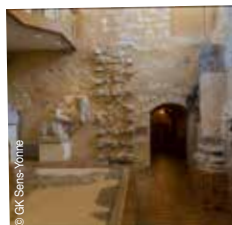
Sens, sa cathédrale et ses musées