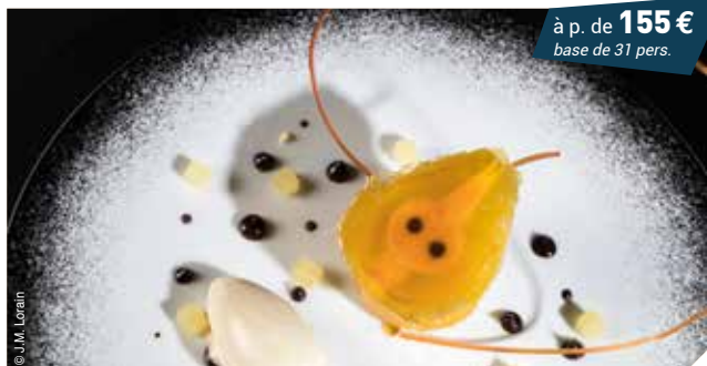
Poire belle hélène