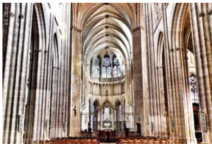
Intérieur cathédrale d'Auxerre

Validité : tous les jours sauf lundi, dimanche matin, matin des fêtes religieuses et certains jours fériés.