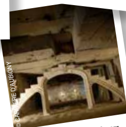
La carrière d'Aubigny