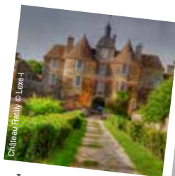
Le château de Ratilly à Treigny