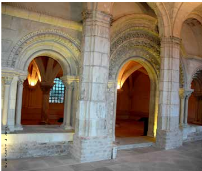
Salle capitulaire de l'Abbaye Saint-Germain

⚠ L'accès à la crypte est limité à 15 personnes par groupe.