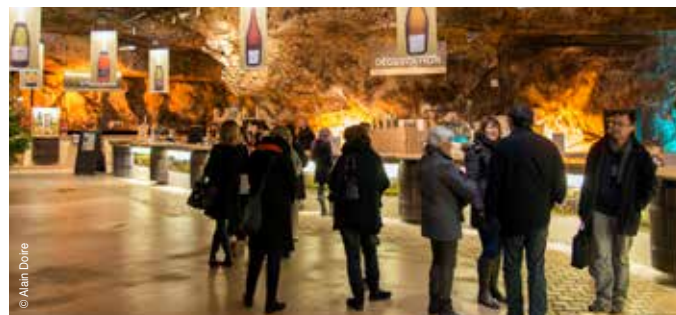
Caves Bailly Lapierre

Découverte des caves Bailly Lapierre , véritable joyau de l'Auxerrois, et des secrets de fabrication de ses Crémants. Dégustation de Crémant de Bourgogne.