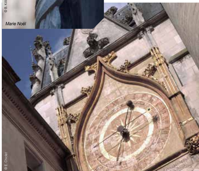
Tour de l'Horloge

Tombez vous aussi sous le charme de la ville et saisissez en l'essentiel au gré de cette promenade, au cours de laquelle l'histoire d'Auxerre vous sera présentée.